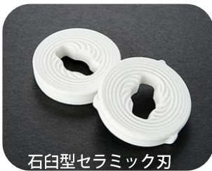
石臼型セラミック刃

セラミック刃なので、簡単に粉末にでき、お料理にも使えます。 石臼型セラミック刃をゆっくり挽くことで、 熱をもたず酸化しにくくお茶本来の風味を楽しめます。 しにくく、使い始めの挽き味が持続します。 セラミック刃は取り外しが可能です。 水洗いしても錆びることがなくていつでも清潔にお使いいただけます